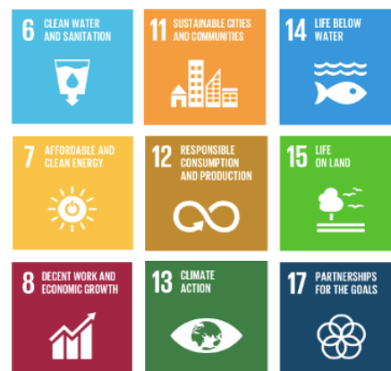
Figura 5. Objetivos de Desarrollo Sostenible (ODS).