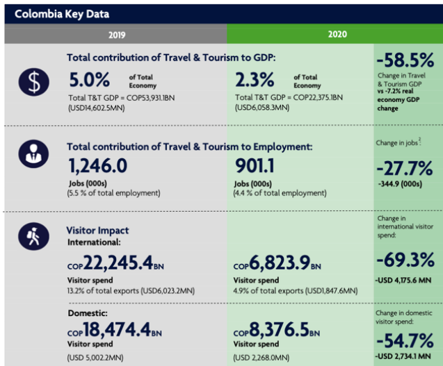
Figura 2. Colombia Annual Research.