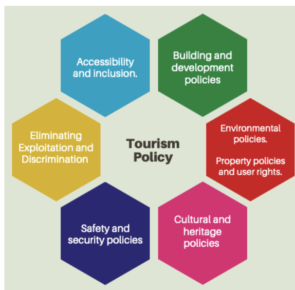
Figura 3. Marco de políticas para desarrollar a través del turismo.

Este informe se centra en el marco de políticas para el éxito del turismo sostenible en Colombia y para definirlo es necesario definir los aspectos y componentes relevantes de los criterios GSTC-D.